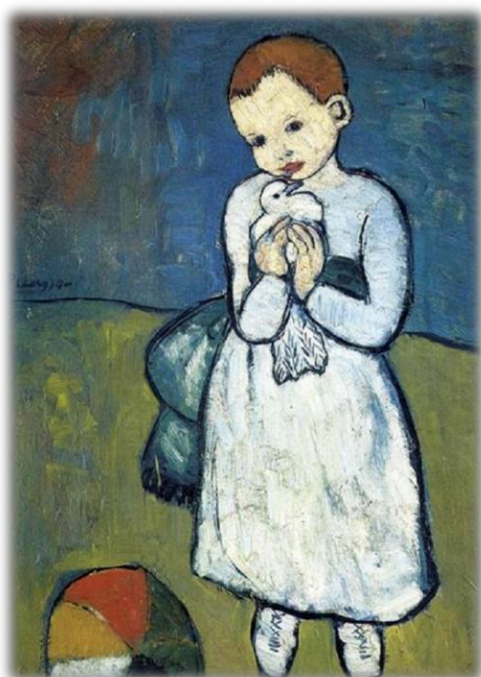
Pablo Picasso, Kind met duif, olieverf, 1901

Weer wordt alles anders, Nu word ik weer betoverd, Door 't allerluchtigste, waar niets van overblijft. Nu lijkt het weer of dat het enig levende is En al 't eenvoudige en harde, alleen décor, Een bodem waar het leven boven drijft. Een gouden haar, Haperend op een donkerblauwe mouw, Een hiëroglief. Sporen van vogelpootjes in de sneeuw, Een ondertoon van lachen in een stem. Vreemd, dat het leven zo terug gaat komen, Achterstevoren, In schaduwen, echo's, lichte sporen.