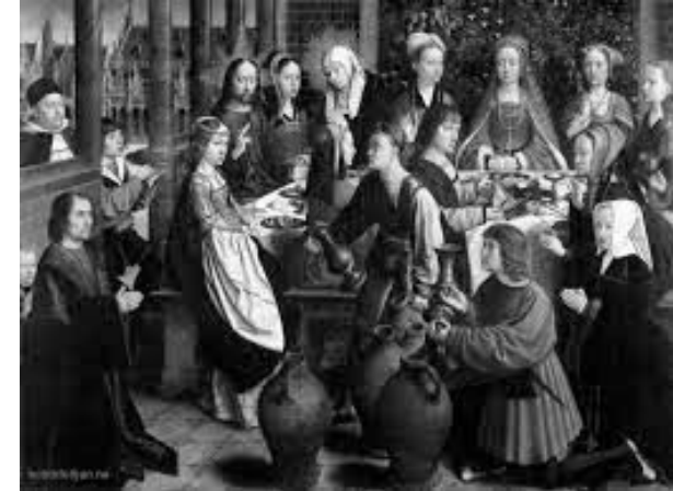
Gerard David (1460-1525) - De bruiloft te Kana